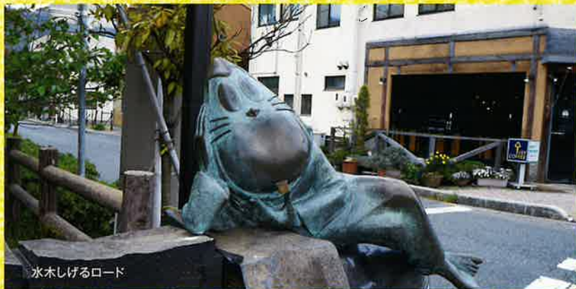
氷木しげるロード