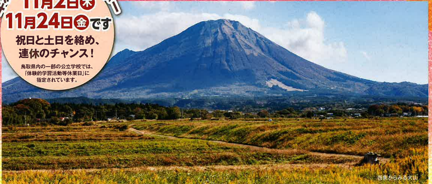
西側からみる大山

年次有給休暇を取得して、家族と過ごしたり、 地域の活動に参加したり、新しい働き方・休み方をはじめましょう。