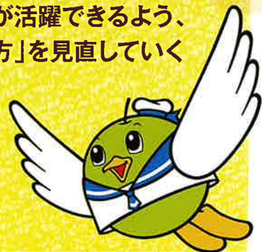
鳥取県マスコットキャラクター「トリピー」