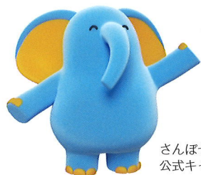
さんぽセンター 公式キャラクター